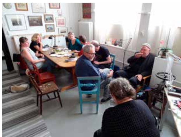
Planerings- och diskussionsmöte på Görans Hörne i augusti