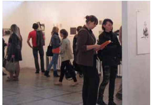
Vernissage i Siauliai konsthall.

Under året har vi genomfört ett utbyte med Siauliai (uttalas schåli) university and Lithuanian Artist Organization "Siauliai Artist's organization". Under våren visades 32 konstnärer från Grafik i Väst i Siauliai konsthall. Och under samma period genomfördes ett par workshops av Ea ten Kate, Jim Berggren och Jon Forssman.