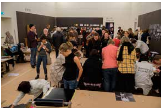
Tre bilder från Tryckverkstaden Göteborgs Konsthall

rum, bibliotek och utställning. Alla fick en unik chans att skapa och utforska olika trycktekniker självständigt eller tillsammans med professionella tryckare och konstnärer. Testa alltifrån letterpress och silkscreen till potatistryck. Experimentera i kända och oväntade material.