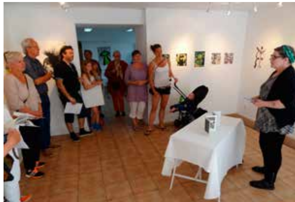
Nya medlemmar hälsas välkomna