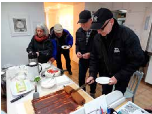
Tårta avåts på Word Art Day

portföljblad och GS grafikprtfölj visades i nedre rummet och tårta avåts i galleriet.